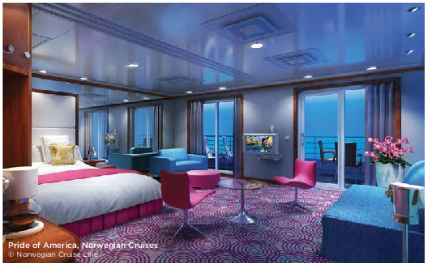
Pride of America, Norwegian Cruises

« Les compagnies de croisières s'affilient à la Chaîne en raison du prestige de notre confrérie, et sont fières des liens établis avec elle. Elles souhaitent découvrir les intérêts culinaires et culturels de nos membres, ainsi que mettre en valeur les talents artistiques de leur personnel. Ce qu'elles font d'excellente manière ! »