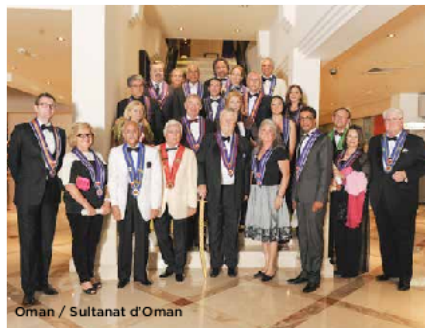
Oman / Sultanat d'Oman