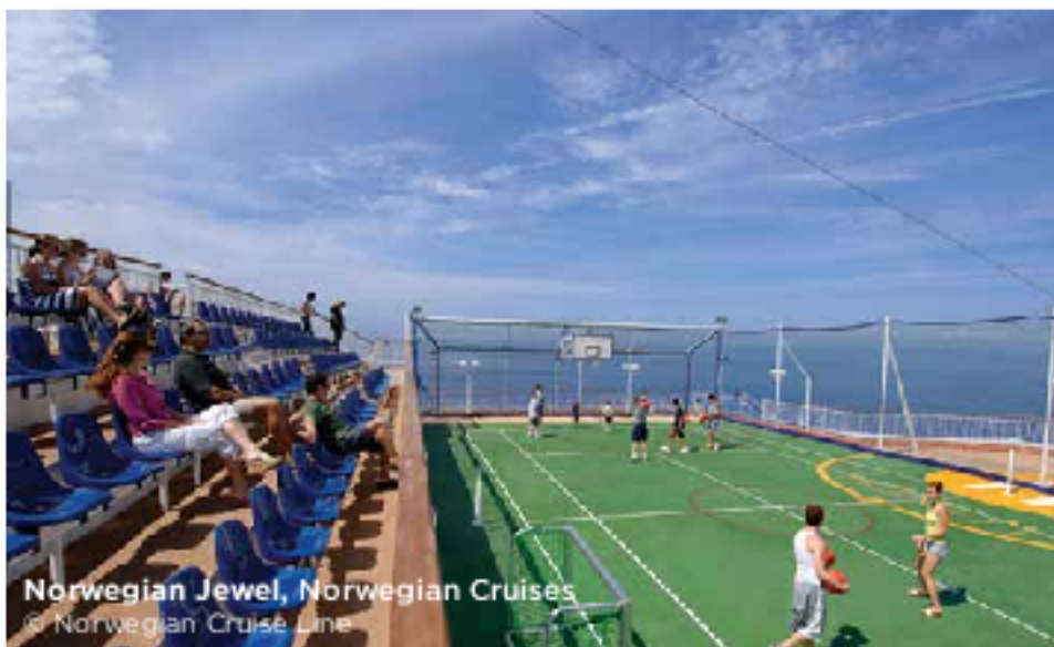
Norwegian Jewel, Norwegian Cruises