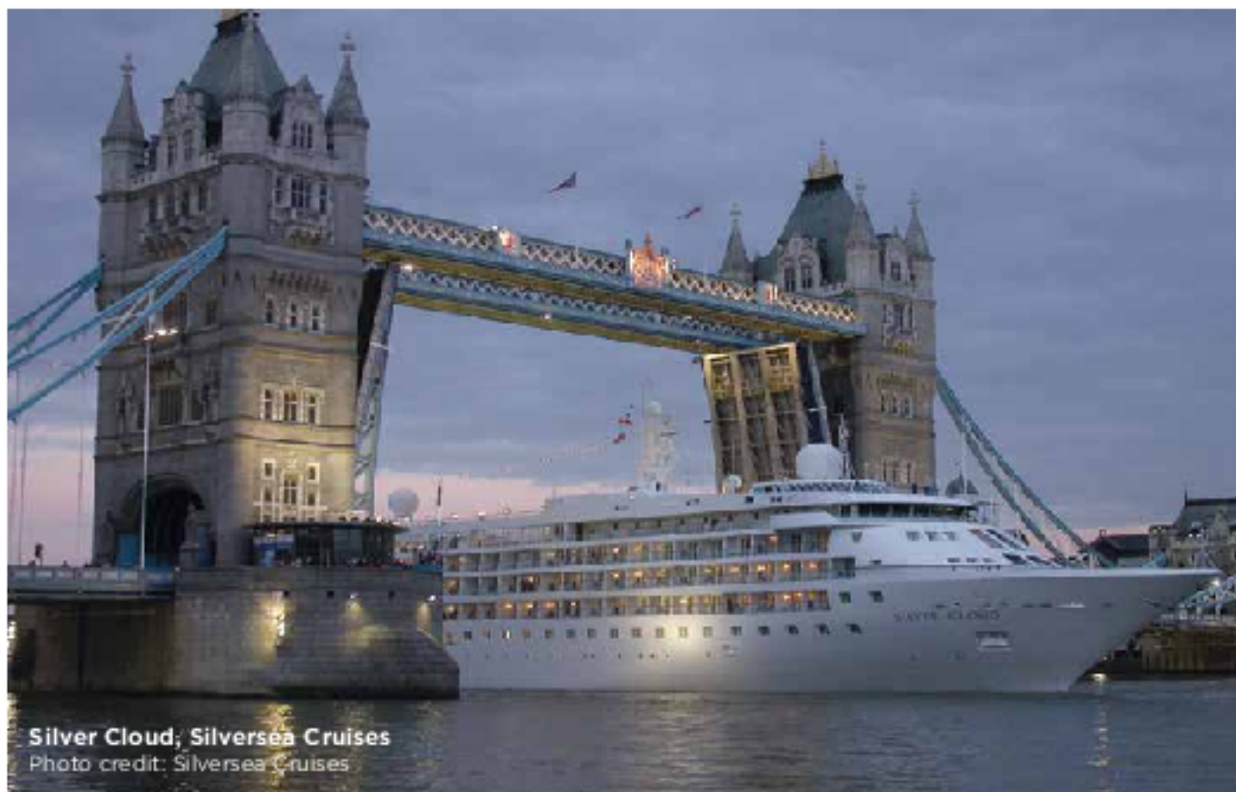
Silver Cloud, Silversea Cruises