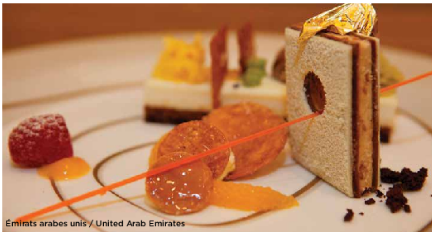
Émirats arabes unis / United Arab Emirates