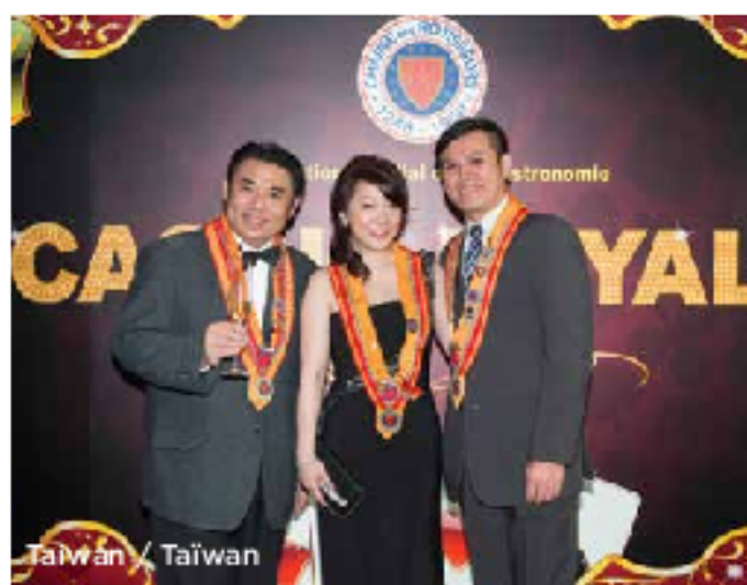
Taiwan / Taïwan