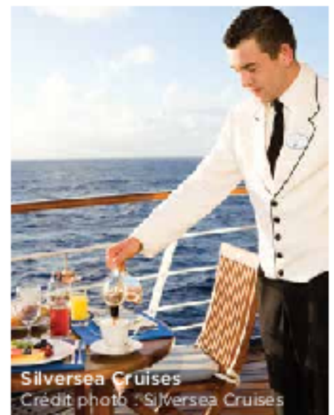
Silversea Cruises