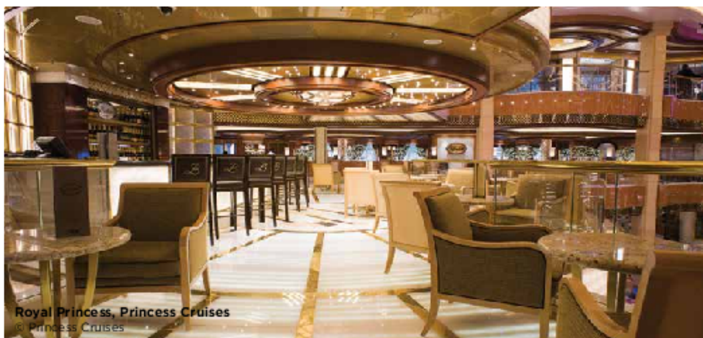
Royal Princess, Princess Cruises