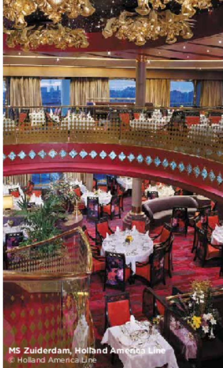
MS Zuiderdam, Holland America Line