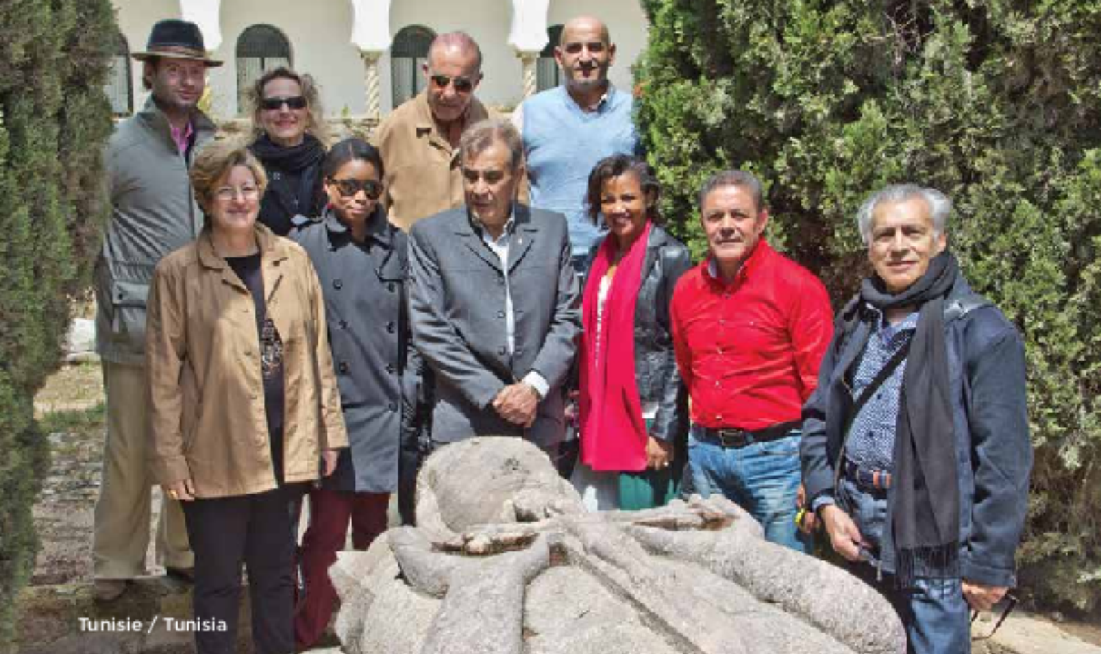
Tunisie / Tunisia