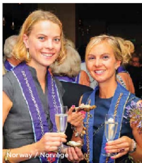
Norway / Norvège