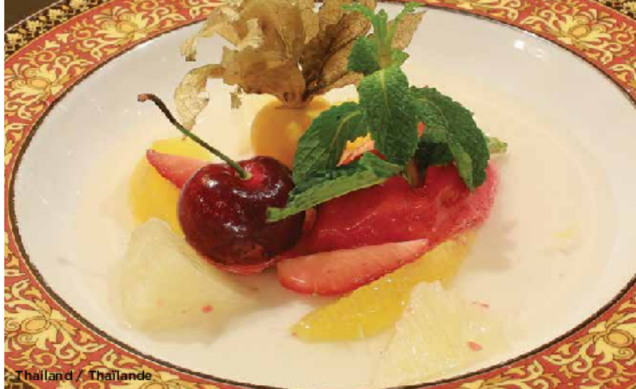
Thailand / Thaïlande