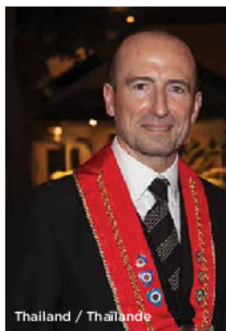
Thailand / Thaïlande