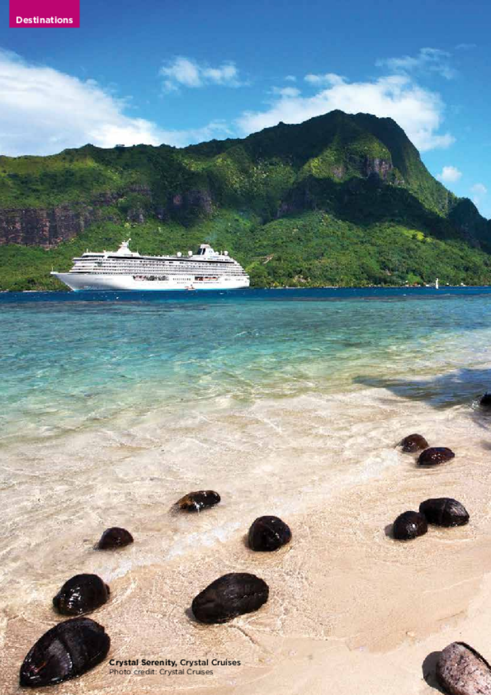
Crystal Serenity, Crystal Cruises