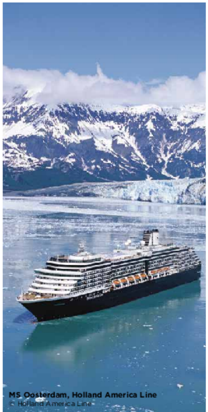
MS Oosterdam, Holland America Line

Pour en savoir plus, consultez le site du Bailliage du Grand Miami : www.MiamiChaîne.org