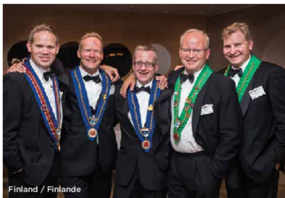
Finland / Finlande