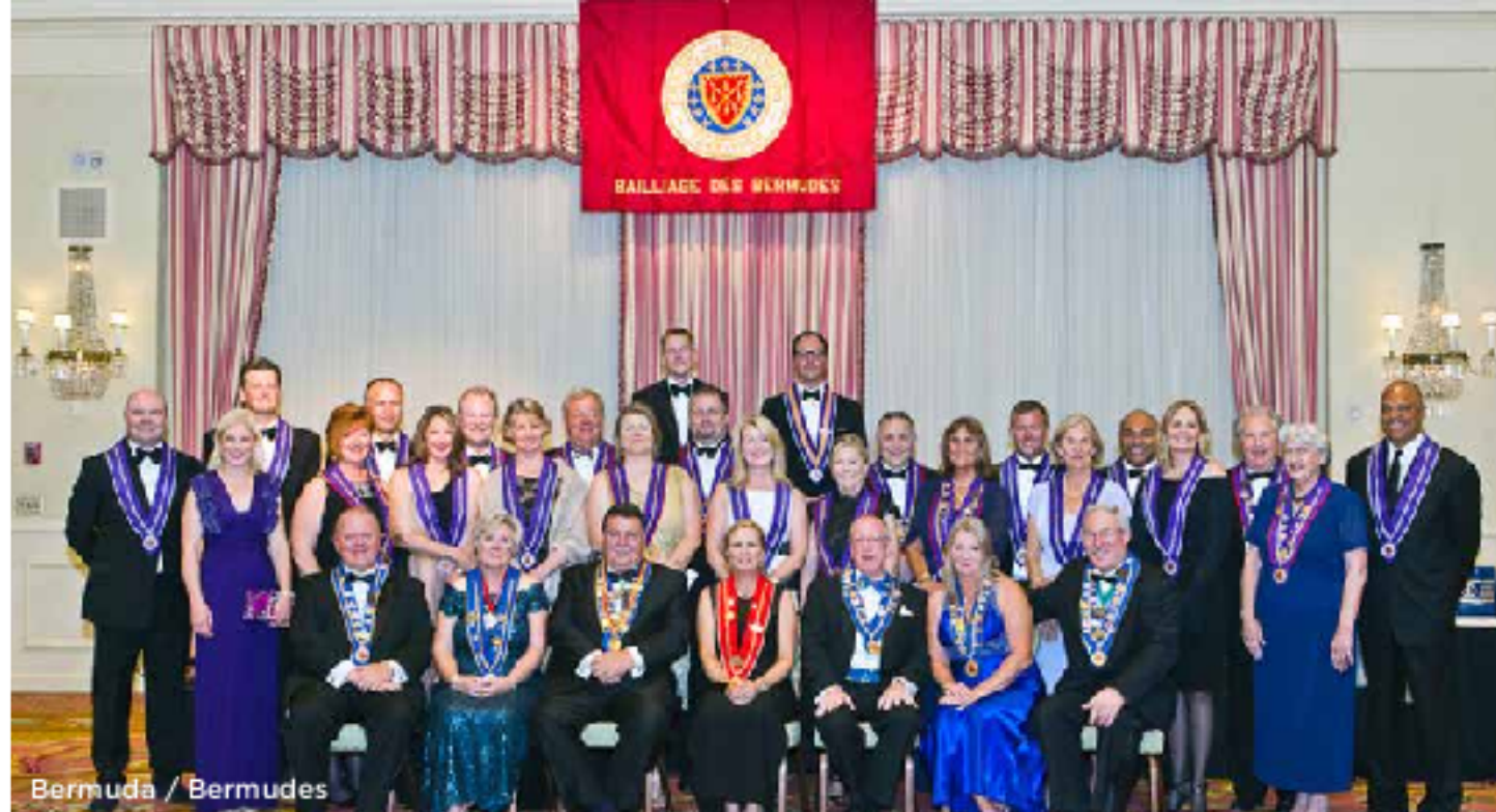
Bermuda / Bermudes