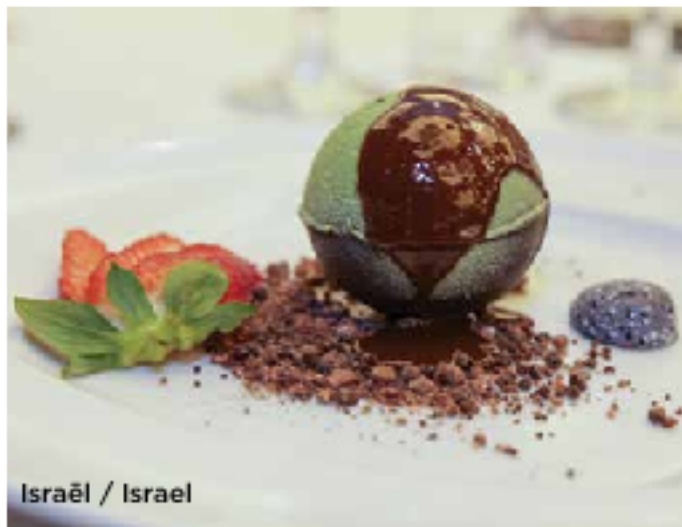
Israël / Israel