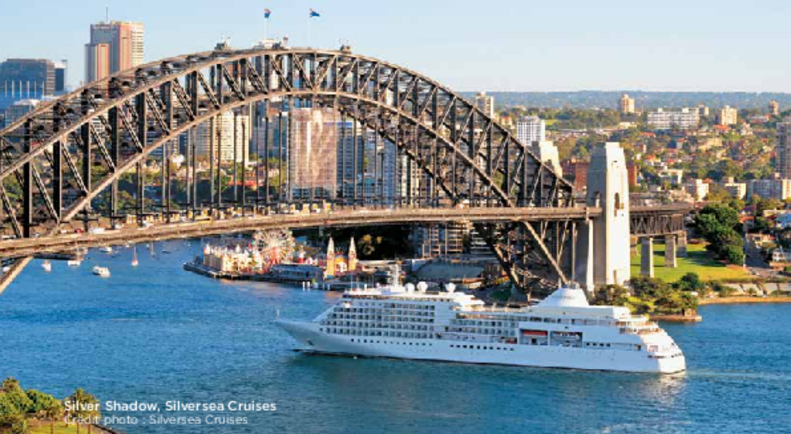
Silver Shadow, Silversea Cruises