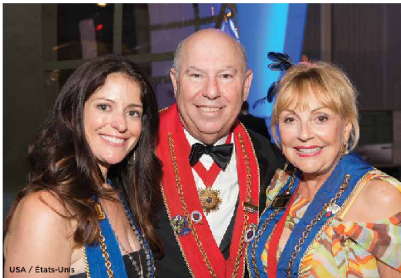
USA / États-Unis