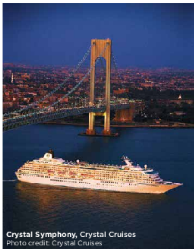
Crystal Symphony, Crystal Cruises